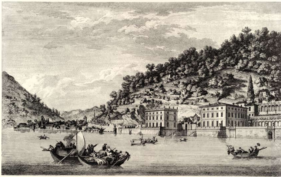
Velata della Villa Tanzi in Ornavasso presso Como

Many country fairs offer gastronomic opportunities, folkloric shows, craft markets, fireworks.